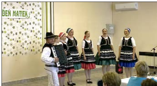
V Oreskom si pripomenuli Deň matiek.