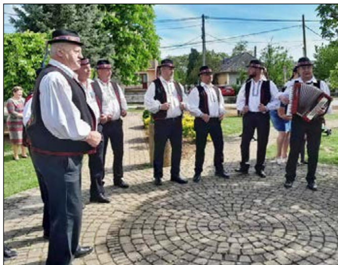
Spevacká skupina Starjani zo Starého svojimi pesničkami spríjemnila stavanie mája aj v susednom Oreskom.

V poslednú aprílovú nedeľu naša obec ožila tradičným podujatím – stávaním mája. Pod modrou oblohou a pri príjemnom jarnom slnku sa v strede obce v parku stretli tí, ktorí chceli osláviť príchod leta a prejaviť hrdosť na naše kultúrne dedičstvo.