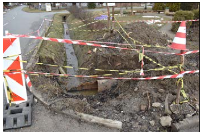
Príválové dažde spôsobili v Oreskom vylíatie potoka v centre obce. Na odstránení problému sa pracovalo ešte v jarných mesiacoch.