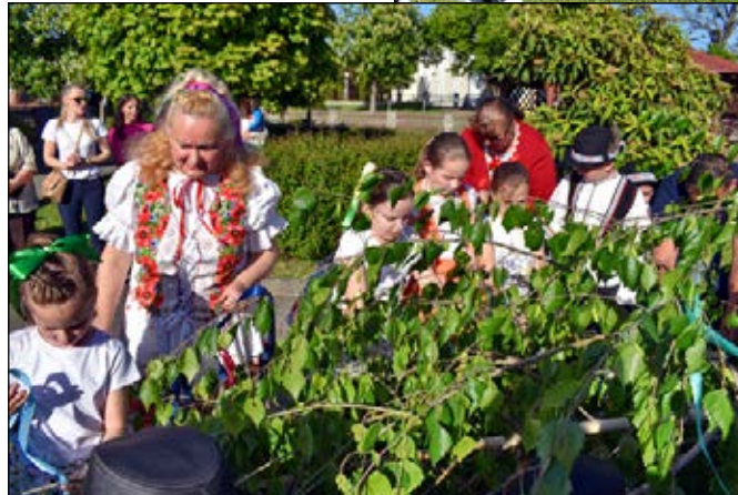
Na zdobení mája v Starom sa podieľali predškoláci i školáci pod dohľadom učiteliek.