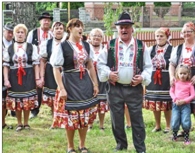
Takto sa bavili Zbudzania počas stávania mája pred desiatimi rokmi.