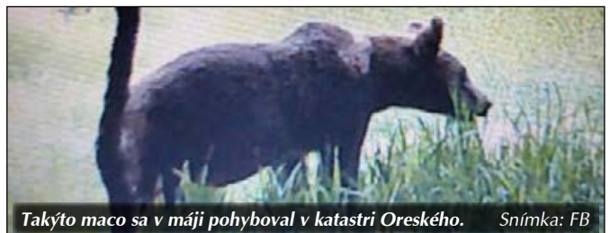
Takýto maco sa v máji pohyboval v katastri Oreského.

K 30. júnu 2024 bolo prihlásených k trvalému pobytu v Oreskom 476, v Starom 757 a v Zbudzi 516 obyvateľov.