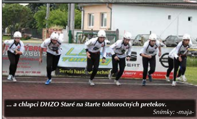
... a chlapci DHZO Staré na štarte tohtoročných pretekov.