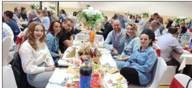
Účastníci prvého rifľového plesu.