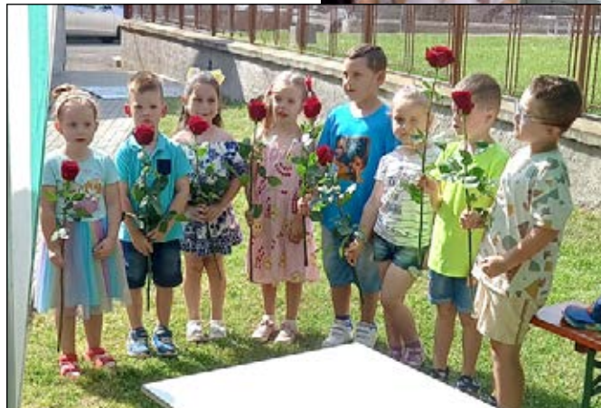
Dojemná rozlúčka s dlhoročnou pedagogičkou MŠ v Zbudzi.