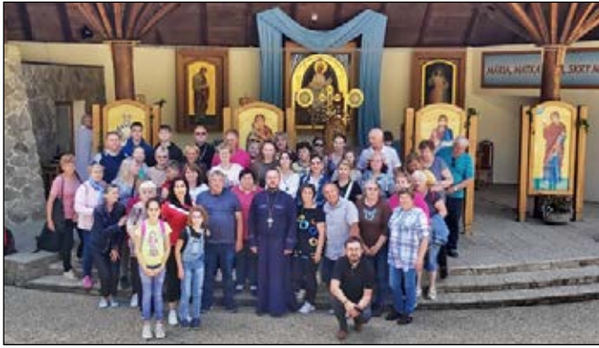
Pútnici z gréckokatolíckej farnosti Zbudza-Oreské na májovej púti v Litmanovej.