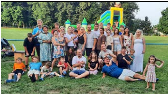
Účastníci farského dňa v Zbudzi, pre ktorých bol pripravený pestrý program.