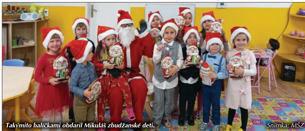
Takýmito balíčkami obdaril Mikuláš zbudžanské deti.

14. január, 15. marec, 12. máj, 12. júl, 12. september, 7. november.