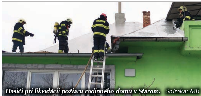
Hasiči pri likvidácii požiaru rodinného domu v Starom.

komína. Hasiči DHZ Staré po zlikvidovaní požiaru vykonávali kontrolnú činnosť miesta požiaru do neskorých večerných hodín. Vedenie obce sa touto cestou chce poďakovať hasičom DHZ Staré za rýchly a profesionálny zásah pri ochrane majetku obyvateľa našej obce. (MB)