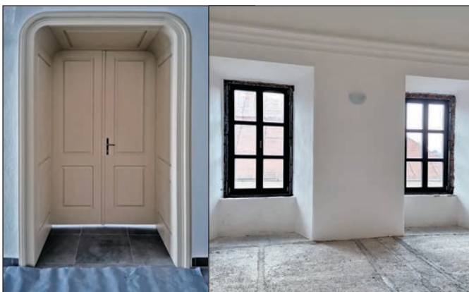
Súčasťou rekonštrukcie kaštiela je aj výmena okien a dverí.

V roku 2021 bola z MK SR poskytnutá dotácia vo výške 20 000 € rozdelená do dvoch častí – na výmenu interiérových dverí a na výmenu okien. Z poskytnutej dotácie bola zrealizovaná výroba 3 kusov interiérových dvojkrídlových dverí s obložkovou zárubňou na poschodí, predelové dvojkrídlové dvere s poloblúkovým nadsvetlíkom chodby na prízemí a výmena 7 kusov okien za eurookná na východnej a južnej strane na poschodí. Zámerom vedenia obce je vyhotovenie interiérových dverí a eurookien v jednotlivých izbách na poschodí kaštiela s ich následným využitím pri rôznych príležitostiach.