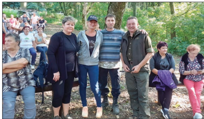
Atmosféra na stretnutí Staranov a Jasenovčanov v Štarianskej doline.