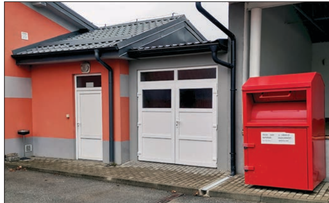
Súčastou rekonštrukčných prác na hasičskej zbrojnici v Starom bola aj výstavba bočného skladu.