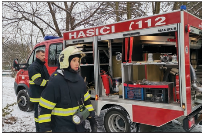
V prípade potreby "vyťahujú" staranskí hasiči techniku aj mimo súťažnej sezóny.

Góly: F. Mandžák 5, Jakub Mandžák 4, Butka 3, Jozef Mandžák 2, Vadel, Puľaková,