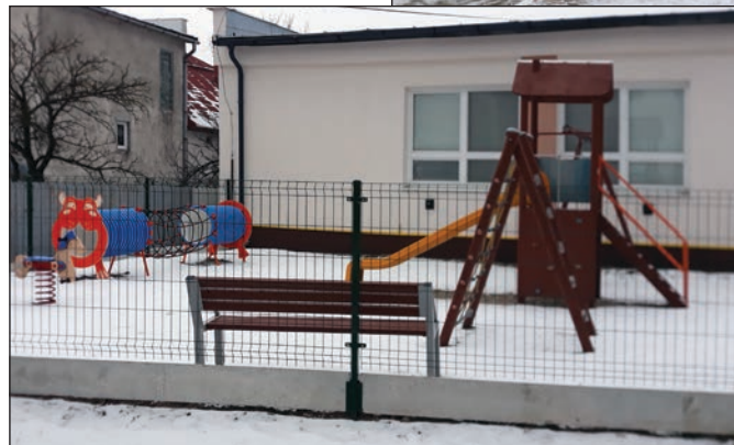
V Oreskom nedávno oplotili detské ihrisko a kultúrny dom. Práce si vyžiadali náklady za takmer 4 400 €.