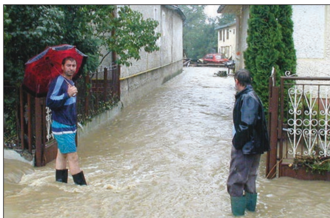
V júli 2001 postihla Staré veľká povodeň. Valila sa do dvorov, pivníc a brala všetko, čo jej stálo v ceste. Dokonca aj autá.

V roku 1831 postihla východ Slovenska epidémia cholery. Neobišla ani obec Staré. Od 15.7. do 3.9. jej podľahlo 60 rímskokatolíkov. V Oreskom podľahlo chole-re (od 29.7. do 4.9.) 25 rímskokatolíkov. V tejto obci pochovávali obeť cholery na odľahlom mieste (tzv. choleraš). Medzi 27.7. a 7.9. bolo aj 31 obetí v Zbudzi. (red)