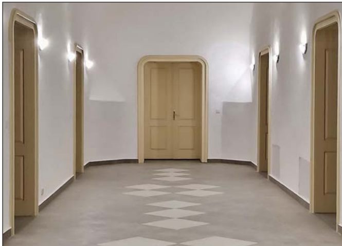
Na poschodí kaštiela pribudli atypické dvojkrídlové dvere s obložkovou zárubňou.

dvojkrídlového balkónového okna s poloblúkovým nadsvetlíkom a položenia veľkoplošnej mrazuvzdornej dlažby na chodbe na poschodí. Pred realizáciou jednotlivých etáp bolo potrebné vykonať nevyhnutné stavebné úpravy stien a priestorov chodby – odstránenie drevených hranolov nad schodiskom, vyhotovenie debnenia a zabetónovanie časti podlahy chodby. Stavebné práce boli realizované od začiatku októbra a ukončené v druhej polovici decembra.