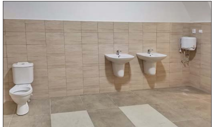
Hygienické zariadenia v ľavej časti prízemnia kaštiela.

Časový priebeh samotnej realizácie prebiehal od začiatku augusta do konca novembra. Realizáciu projektu nepriaznivo ovplyvnila pandémia COVID-19 v našej obci, čo spôsobilo prerušenie prác na obdobie štyroch týždňov.