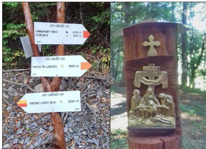
V Oreskom majú náučný chodník a krížovú cestu v prírode. Zorientovať sa návštevníkom pomôžu osadené smerové tabule.

Po náročných dňoch v úrade rád relaxuje v záhrade i v kruhu svojej rodiny. Preto mu do ďalších rokov prajeme predovšetkým pevné zdravie, trpezlivosť pri vykonávaní svojej práce. A. F.