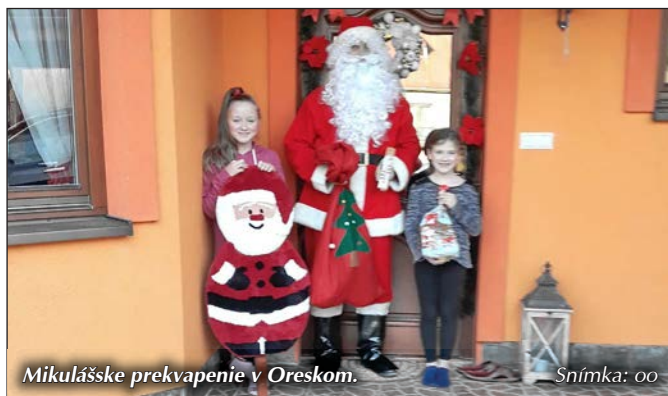
Mikulášske prekvapenie v Oreskom.

Ďakujeme, Mikuláš, za darčeky, za nečakané prekvapenie a opatruij sa, nech si zdravý a nech sa spolu stretneme aj budúci rok. M. M.