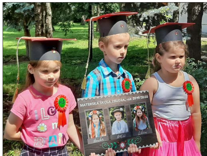
Najmladší absolventi MŠ Zbudza.

Prežili sme spoločne zase jeden krásny a veselý školský rok. S niektorými deťmi sme sa rozlúčili a s niektorými sa po prázdninách znovu stretávame. D. B.