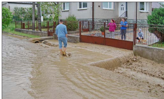
Prvomájové zrážky v Starom spôsobili zaplavenie viacerých záhrad, pivníc, polí i miestnych komunikácií.

Za účelom zveladenia životného prostredia obyvateľov obce samospráva zrealizovala v časti Hušták úpravu verejného priestranstva odstránením suchých a poškodených drevín a odstránením náletových krovín. Podobne v časti obce Pustiňa pri "globe" bola realizovaná úprava verejného priestranstva odstránením náletových drevín. Ďalšiu úpravu priestranstva odstránením náletových krovín obec vykonala v okolí EKO SKLÁDKY. (-mib-)