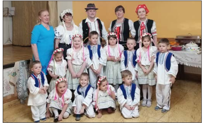
Fašiangy v Zbudzi. Zabávali sa malí i veľkí.