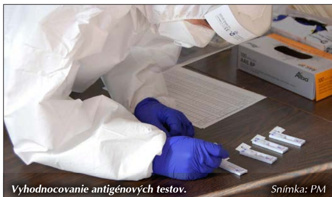
Vyhodnocovanie antigénových testov.

V rámci celoplošného testovania (1. a 8. novembra) bolo v areáli obecného úradu zriadené odborné miesto. Testovanie prebehlo v réžii Ministerstva obrany Slovenskej republiky. Obec poskytla priestory, zabezpečila administratívnych pracovníkov a stravovanie pre členov odberového tímu. Výsledkami z obidvoch kôl testovania obec nedisponuje. M. B.