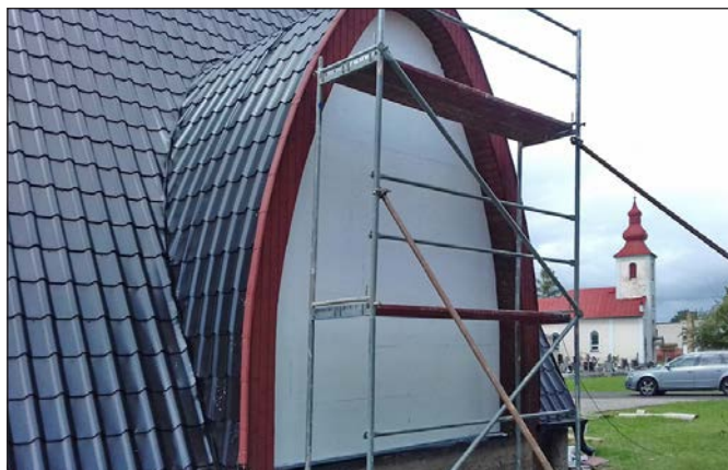
Dom smútku v Zbudzi nadobudol po nedávnej rekonštrukcii nový vzhľad.

Podakujeme Pánu Bohu za skončený rok 2020, že nám dal zdravie a sily prežiť ho v takej veľmi ťažkej celosvetovej situácii a dúfajme, že nový rok bude lepší, ako ten predchádzajúci. A. J.