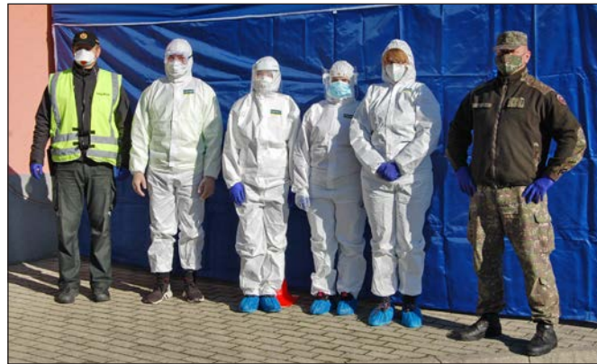
Jeden z testovacích tímov počas krátkej prestávky.

Viac o investičných aktivitách v obci Staré sa dočítate vo vnútri tohto dvojčísła.