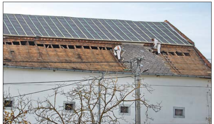
Výmena strešnej krytiny na KP Sýpka.

Vzhľadom na obmedzené množstvo finančných prostriedkov v roku 2020 bola realizovaná výmena strešnej krytiny na troch štvrtinách strechy a výmenu strešnej krytiny na poslednej štvrtine chceme realizovať v roku 2021. Realizácia projektu začala v druhej polovici mesiaca októbra a bola ukončená koncom decembra 2020.