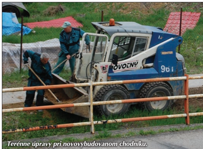
Terénne úpravy pri novovybudovanom chodníku.

Okrem uvedených akcií boli vedením obce priebežne realizované a zabezpečované aj iné úlohy súvisiace s potrebami našej obce. (mib)