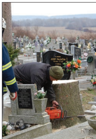
V tomto roku bolo na cintoríne v Starom spílených 17 stromov.