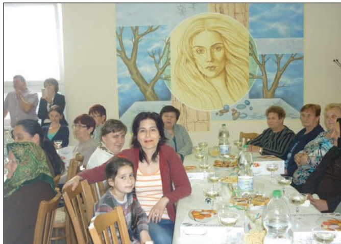
V Oreskom si aj v tomto roku pripomenuli Deň matiek.