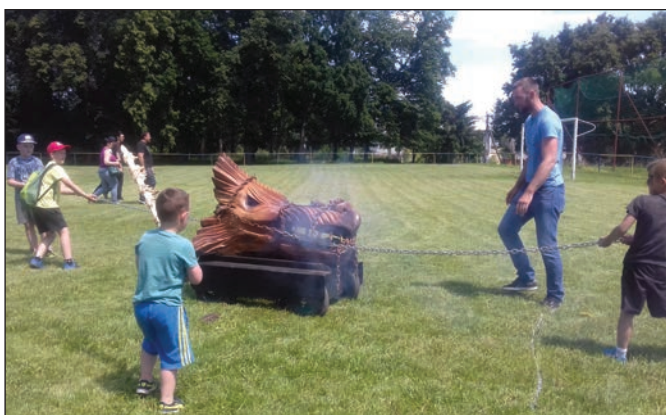
Jednou z atrakcií osláv Dňa detí v Zbudzi bolo aj ťahanie draka.

K 30. júnu 2019 bolo prihlásených k trvalému pobytu v Oreskom 490 , v Starom 760 a v Zbudzi 524 obyvateľov.