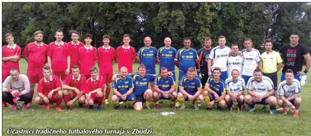
Účastníci tradičného futbalového turnaja v Zbudzi.

Vyžrebovanie uvádzame na inom mieste. Takže „športu zdar – futbalu zvlášť!“ (P.Z.)