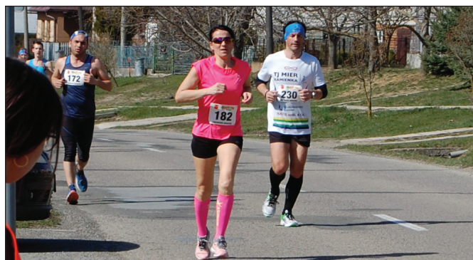
Na trati 14. ročníka CB Laborecká desiatka.

Na tomto podujatí si účastníci pripomenuli aj 250. výročie úmrtia Imricha Stárāja (1698 – 1769), ktorý patril medzi najvýznamnejších príslušníkov rodu a zaslúžil sa o spoločenské pozdvihnutie rodiny. (rk)