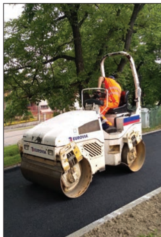
Novej prístupovej komunikácii od štátnej cesty k rodinným domom sa potešili viacerí Starania.

Z celej tejto akcie bolo cítiť, že bola pripravovaná s úctou k minulosti a láskou k súčasnosti, za čo patrí vďaka všetkým, ktorí sa pričínili o jej vydarený priebeh. -umš-