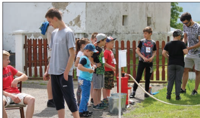
Momentka z obecných osláv detského sviatku v Starom.

Najvytrvalejší účastníci osláv Dňa detí sa ešte vyšantili na miestnom amfiteátri, kde sa konal juniáles, ktorý ukončil celé podujatie. (j-)