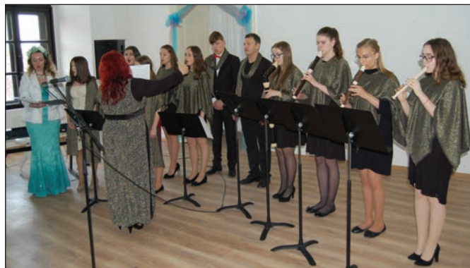
Vystúpenie žiakov a pedagógov ZUŠ Michalovce v Starom.