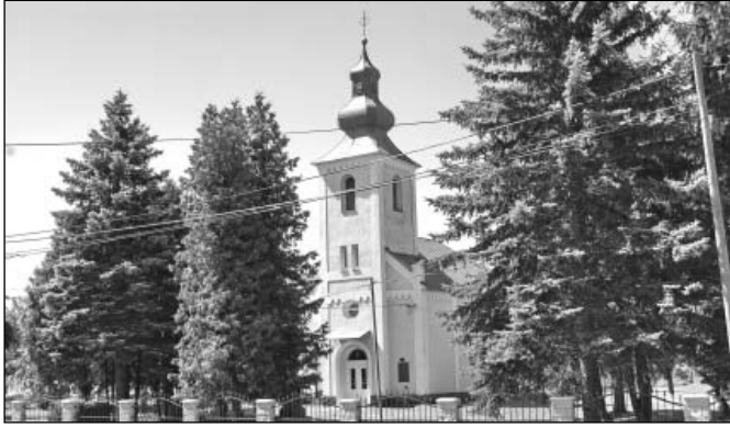
Súčasný pohľad na 75-ročný gréckokatolícky Chrám Premenenia Pána v Zbudzi.