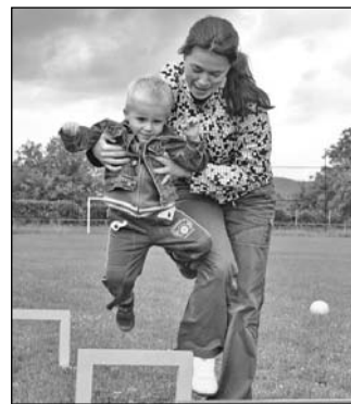
Medzinárodný deň detí oslávili taktiež deti v Zbudzi. Aj takto sa mladí Zbudžania zabávali.

Starostka a poslanci obecného zastupiteľstva