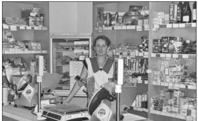
Po dvoch desaťročiach sa spoločnosť COOP Jednota opäť vrátila do Oreského. Po polročnej prevádzke sú obyvatelia obce so sortimentom i prístupom vedúcej predajne spokojní. Podrobnejšie sa dočítate v článku Jednota sa vracia na str. 1.

K 30.6.2013 bolo k trvalému pobytu v Oreskom prihlásených 489, v Starom 785 a v Zbudzi 535 osôb.