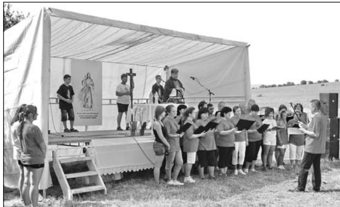
Snímka JPZ je z 2. farského dňa. Podrobnejšie v článku prekvapenie zo Starého na str. 3.

Na jednom zo zasadnutí obecného zastupiteľstva sa poslan-