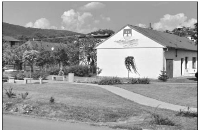
Súčasný pohľad na centrum Oreského