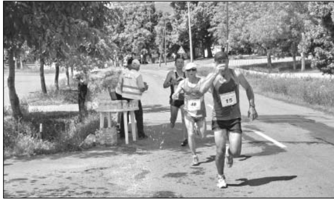
Nielen so súpermi, ale aj s úmornou horúčavou bojovali pretekári na 8. ročníku cestného behu Laborecká pätnástka, ktorého prevažná časť viedla cez obec Staré.