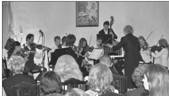
V obci Staré sa v posledných rokoch buduje tradícia koncertov vážnej hudby. Staranská hudobná jar napísala v máji už štvrtú úspešnú kapitolu.

Krátko pred pätnástou hodinou sa prezentoval chrámový spevácky zbor Lusticus programom „Spievajme Márii“ a o pätnástej hodine spoločne s ďalšími prítomnými Ružencom k Božiemu Milo-