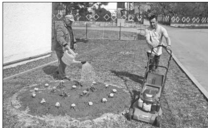
Údržba zelene v centre Oreského.