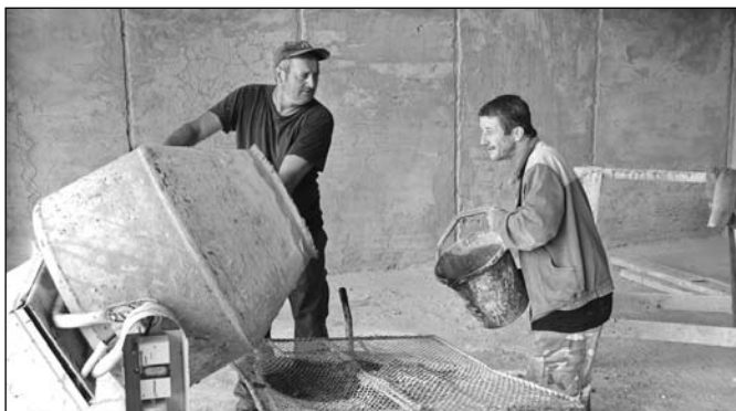
Práce na staranskom amfiteátri finišujú.