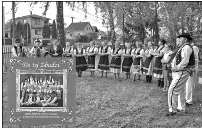
Členovia FS Solanka sa môžu popýšiť novým „cédečkom“.